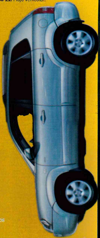
Tabla 11: Flujo Vehicular.