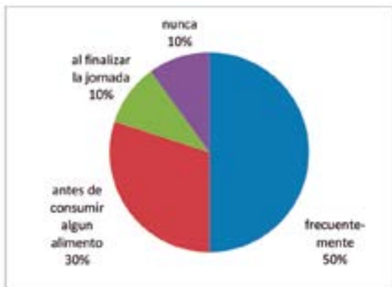
Figura 3. Higiene durante la jornada laboral

En la Figura 3 se puede observar que el 50% de los trabajadores dedicados a la recolección de basura se lavan las manos frecuentemente durante su jornada laboral. Otro 10% no se las asea por ningún motivo, 30% de ellos lo hace antes de consumir algún alimento, y un 10% de la totalidad lo realiza al finalizar la jornada laboral. Lo cual demuestra la falta de higiene y capacitación de los riesgos que implican no tener este hábito durante la jornada de trabajo como recolector de basura en el GAD Municipal Coronel Marcelino Maridueña.