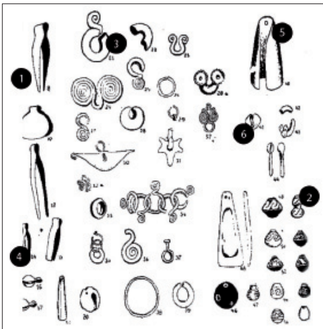
Figura 2: 1.- Pinzas depilatorias; 2.- Fusaiolas o torteros” que servían para hilar; 3.- Narigueras; 4.- Clavos faciales (adornos para la nariz); 5.- Sonajeros; 6.- Cascabeles.

El trabajo de campo realizado por Viteri Gamboa, es mencionado en los trabajos arqueológicos realizados por Estrada, Evans y Meggers. “En vista de la transcendencia del problema emprendieron Estrada, Evans y Meggers