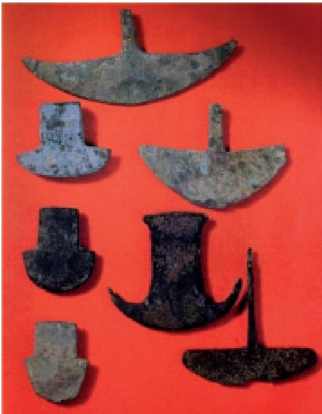
Figura 1. Hachas monedas

utilizadas por nuestros primitivos pobladores, para el trueque o intercambio comercial entre los pueblos de la sierra y costa” [7], conforme investigaciones in situ lo han comprobado. Ver Figura 1.