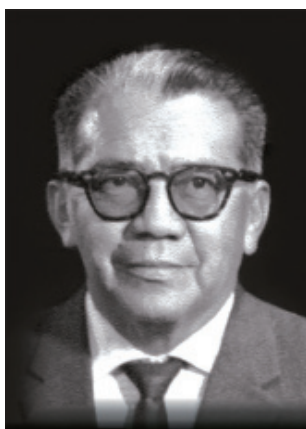
Foto 1. Arqueólogo Julio Viteri Gamboa. Quito, 8 de enero 1908 - Milagro, 28 enero 1986

Además, este estudio permite destacar que desde Milagro, se han llevado a cabo importantes investigaciones de lo que realizó el hombre de la pre-historia e historia, éstas han sido expuestas en foros regionales, nacionales o internacionales por Viteri Gamboa, alcanzando el reconocimiento de los más destacados arqueólogos a nivel mundial. Ubicar en los contextos cien-