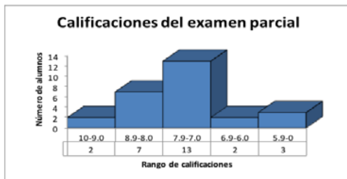
Figura 1. Calificaciones sobre el examen del método de Gauss-Jordan en el ciclo escolar 2014 (datos históricos).

Esta investigación recuperó las calificaciones de los alumnos de la asignatura Matemáticas intermedias para los negocios sobre el examen parcial del método de Gauss-Jordan durante el ciclo escolar 2014 (datos históricos). La Figura 1 muestra que la mayoría de los estudiantes (n=13) se ubican en el rango de 7.9 a 7.0. De hecho, 18 de los alumnos (66.66%) presentan una calificación inferior a 8.