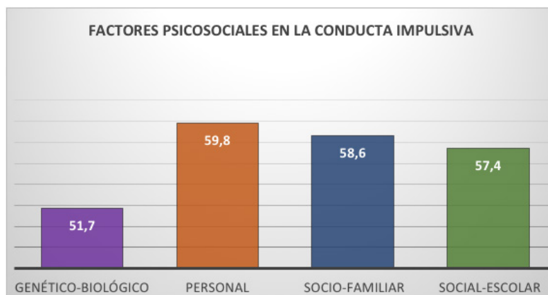
Figura 1. Nivel de impulsividad en 214 participantes

Objetivo 2.- Determinar la incidencia de la conducta impulsiva en los adolescentes de 13 y 14 años.