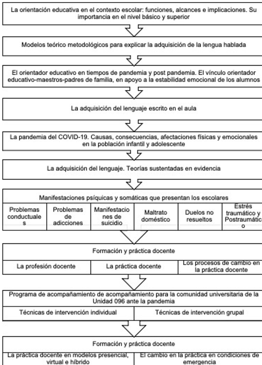
Figura 1. La Formación Teórica: Contenido Temático

Formación Técnico – Metodológica: Esta fase abarcó un lapso de 5 semanas de 20 horas cada una con un total de 100 horas. El objetivo se centró en proporcionar estrategias específicas a los estudiantes acerca de las técnicas que emplearían en estos casos; se preparó a los estudiantes en las