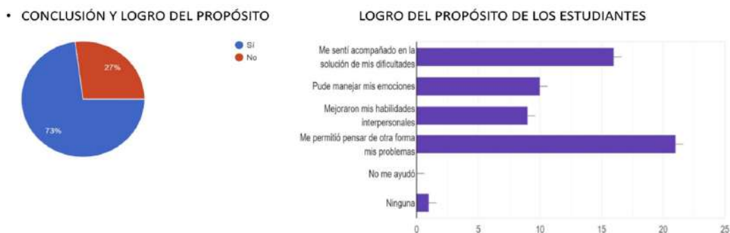
Figura 3. Logro del propósito

Estos logros requirieron el uso de diversas técnicas terapéuticas, la más frecuente fue la de “manejo de